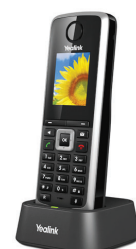
Yealink W52P DECT